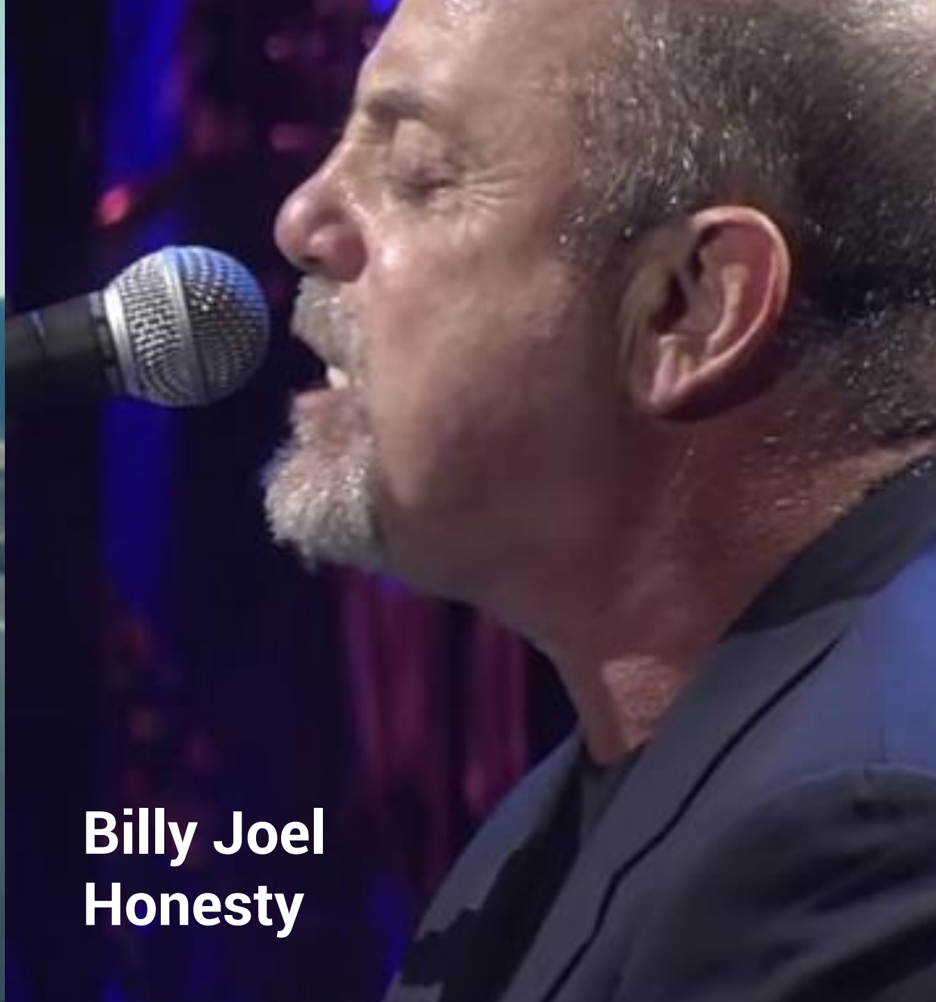
Billy Joel Honesty