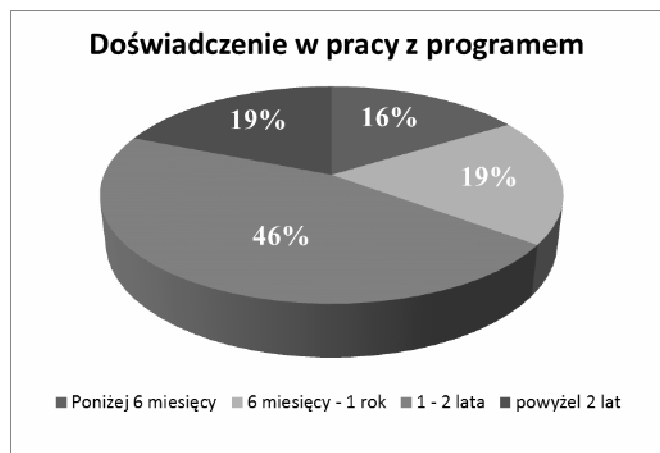
Rys. 3. Doświadczenie kursantów w pracy z danym programem Autodesk

Spośród 65 ankietowanych zdecydowana większość zadeklarowała wcześniejsze doświadczenie w pracy z programem trwające ponad rok (rys. 3), z czego 46% ankietowanych określiło swoje doświadczenie jako 1 – 2 lata, a 19% jako powyżej dwóch lat. 16% uczestników miało mniej, niż 6 miesięcy doświadczenia w pracy z programem, a 19% używało wcześniej programu przez okres od 6 miesięcy do roku.