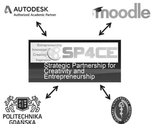
Rys. 1. Schemat współpracy partnerów projektu SP4CE

W projekcie uczestniczyli przedstawiciele dwóch uczelni wyższych – Politechniki Gdańskiej oraz Gdańskiego Uniwersytetu Medycznego, a także pracownicy kilku firm zewnętrznych, które zajmują się szkoleniami i certyfikacją. Schemat współpracy w oparciu o narzędzia e-learningowe został przedstawiony na poniższym rysunku. (Rys. 1.).