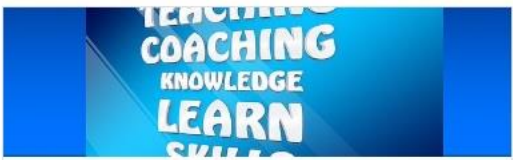
Miscellaneous IwE 2020 - Warsztaty CoLED