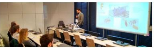
Miscellaneous Moodle for Beginners Teachers