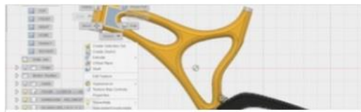
Miscellaneous Fusion 360