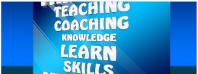
Miscellaneous IwE 2020 - Warsztaty CoLED