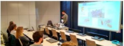
Miscellaneous Moodle for Beginners Teachers