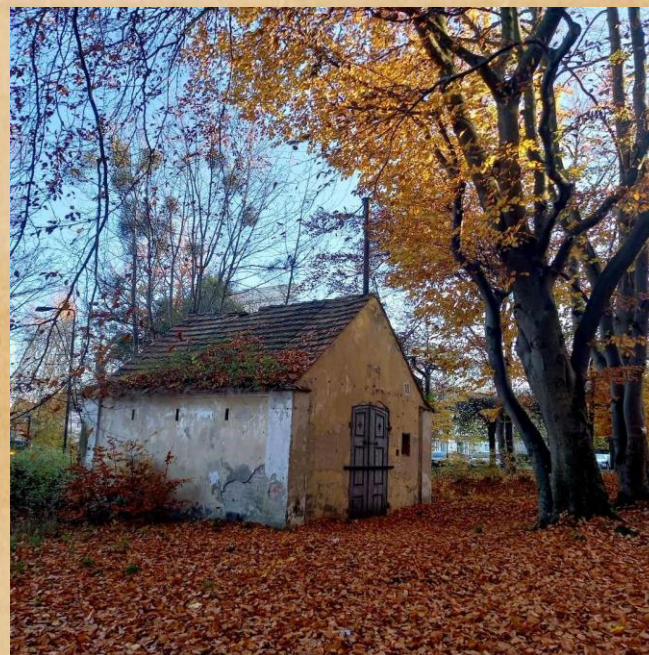
Kaplica cmentarza w 2021 r