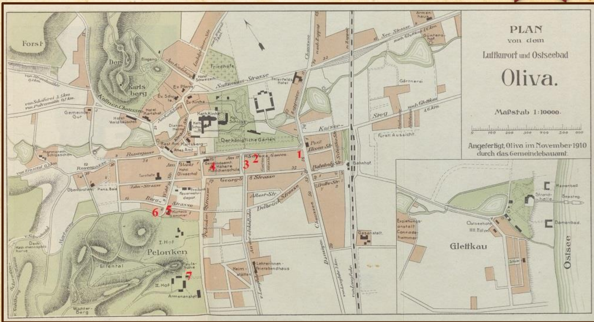
Plan Oliwy z 1910 r.