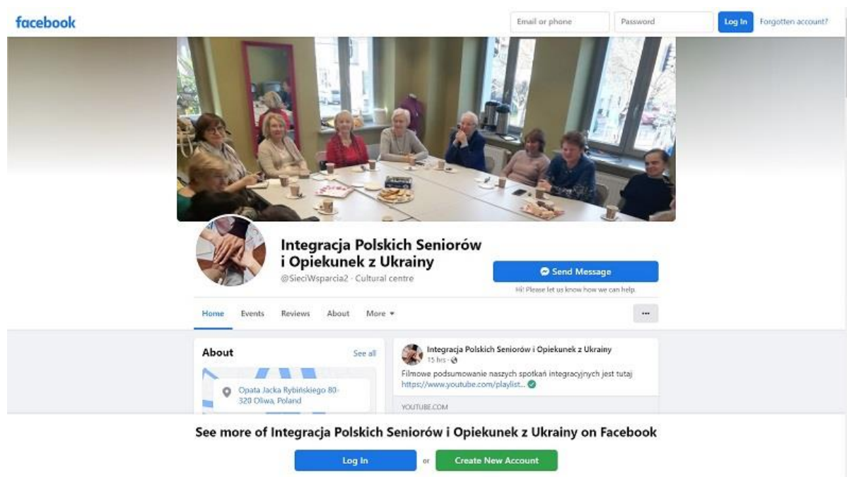
Rys.2. Fanpage Integracja Polskich Seniorów i Opiekunek z Ukrainy

W związku z wybuchem konfliktu zbrojnego w Ukrainie fanpage wspiera dzielenie się informacjami na temat oferowanej pomocy dla uchodźców.