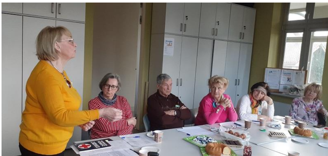
Rys.8. Warsztaty „Jak opiekować się osobą chorą oraz radzenie sobie w trudnych sytuacjach”