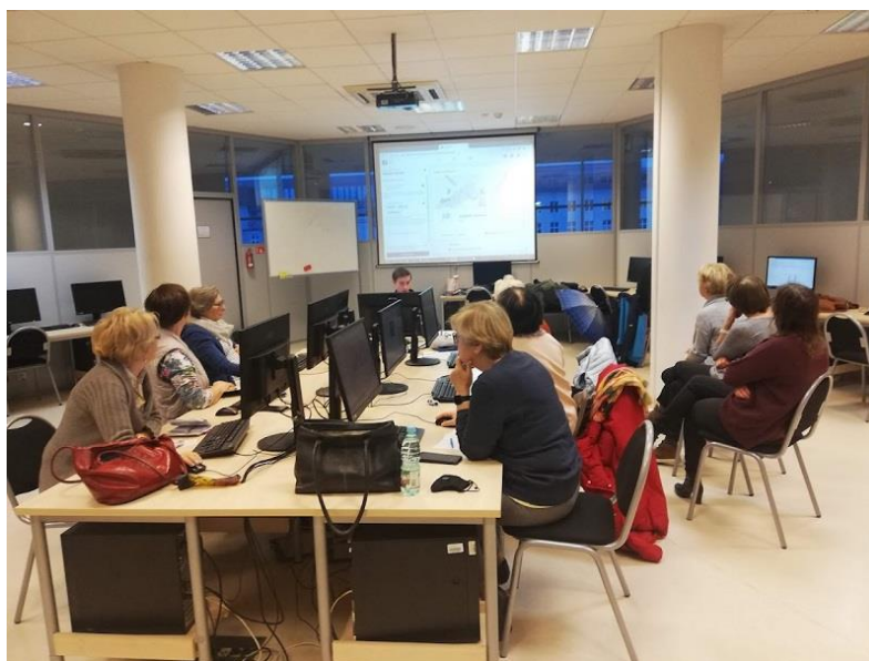
Rys.5. Spotkanie integracyjne dla polskich seniorów na Wydziale Elektroniki Telekomunikacji i Informatyki Politechniki Gdańskiej, 18.11.2021