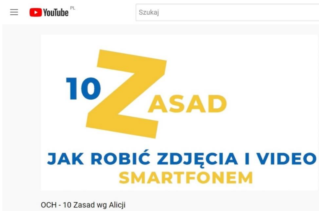
Rys.1. Dodatkowe warsztaty integracyjne dotyczące tworzenia filmików na smartfonie.

Korzystny efekt edukacyjny przynieść może dodatkowe spotkanie integracyjne/warsztaty, poświęcone tworzeniu filmików na smartfonie. Do prowadzenia takich warsztatów wystarczą smartfony i wolontariusz, na przykład Latający Animator Kultury. Filmiki szkoleniowe dla osób zainteresowanych przeprowadzeniem szkolenia umieszczono na kanale YouTube Integracja Polskich Seniorów i Opiekunek z Ukrainy- Opowiadanie Cyfrowych Historii .